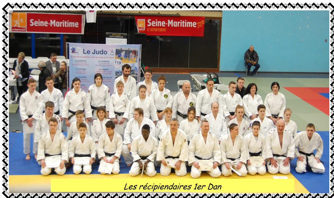
Les récipiendaires 1er Dan

Bulletin de liaison des Ceintures Noires édité par le Conseil Culture Judo de la Seine-Maritime.