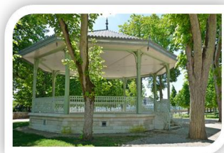
Le Parc Blossac

En revanche, si l'Histoire n'est pas votre passion, pas de soucis ! Nous pourrions croire avec que la ville de Poitiers est ancrée dans son passé reconnu, mais Poitiers n'est pas le cas. Ville dynamique, Poitiers abrite de nombreuses infrastructures comme la Médiathèque, le Confort Moderne, le Parc des Expositions, et la Pépinière entre autres bien entendu. Alors Poitiers, entourée de ses commerces, ses attractions sportives, son coin animalier, ou même ses espaces verts vous offre une large palette de couleurs et d'émotions. Tous ces sites permettent alors un continuel balai d'organisations socio-culturelles.