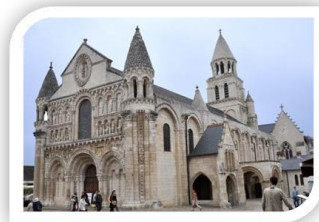
Notre Dame le Grande

Poitiers constitue le chef-lieu du département de la Vienne. Cette ville est aussi la capitale régionale du Poitou-Charentes. Cette position régionale importante fut permise par une importante empreinte historique. En guise d'exemple, nous pouvons citer Sainte Radegonde qui créa à Poitiers au VI ème la première abbaye française exclusivement féminine. Par ailleurs la ville est nommée « ville aux cent clochers » pour ses nombreuses églises. Nous vous invitons à prendre du plaisir et à flâner dans les rues et ruelles du vieux Poitiers où vous attendent de nombreuses surprises architecturales et historiques.