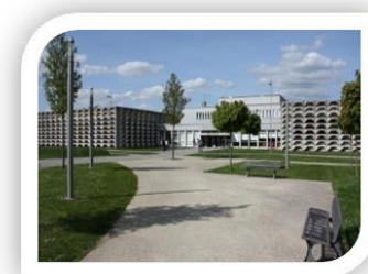
Campus de Poitiers

Pour terminer, cette capitale régionale accueille depuis 1431 de nombreux universitaires. Les plus brillants sont René Descartes ou encore François Rabelais. Concernant l'attrait de la ville de Poitiers pour son université, nous pouvons dire que celui-ci est grand. Cela en est même devenu une tradition : Poitiers a su préserver et faire fructifier son pôle universitaire puisqu'elle est actuellement la ville ayant la plus grande proportion d'étudiants comparée à la population totale.